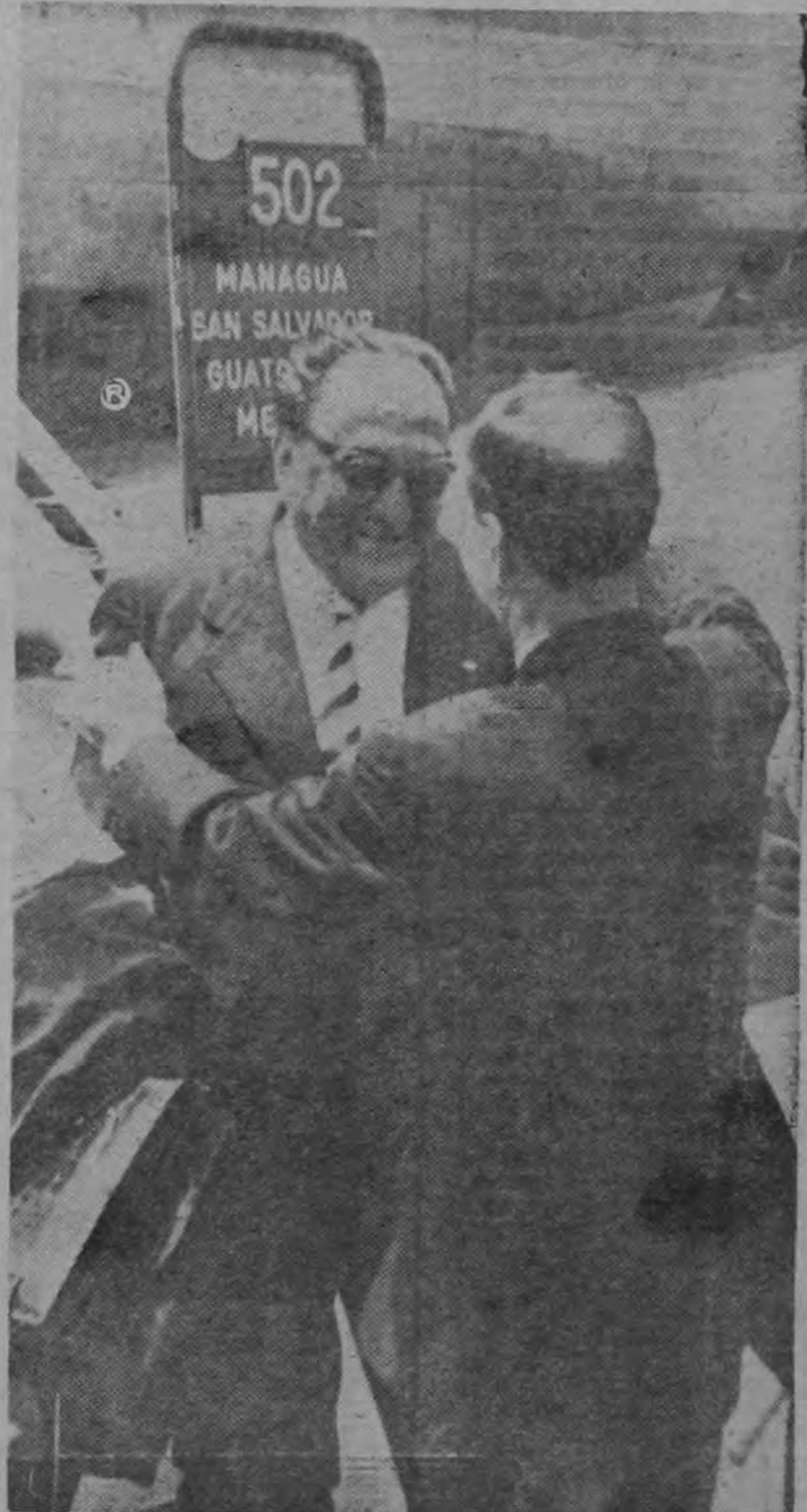
Don José Figueres se acerca al líder aprista para abrazarlo. Fue un momento de gran emoción. Haya de la Torre y el señor Figueres son viejos y entrañables amigos.

Respondiendo a una pregunta de Mario Ramírez Villalobos de La Palabra de Costa Rica, sobre las condiciones de vida en los países nórdicos y la posibilidad de adaptación de muchos de sus progresos sociales en nuestro continente, Haya de la Torre dijo que tal cosa bien puede hacerse. Señaló su especial afecto por esos pueblos con la cita de su obra "Mensaje de Europa Nórdica", y agregó que era esa una de las pocas regiones del mundo donde se cumplían a cabalidad, en el diario vivir, los eternos postulados de justicia social, y se respetaba la dignidad de la persona humana.